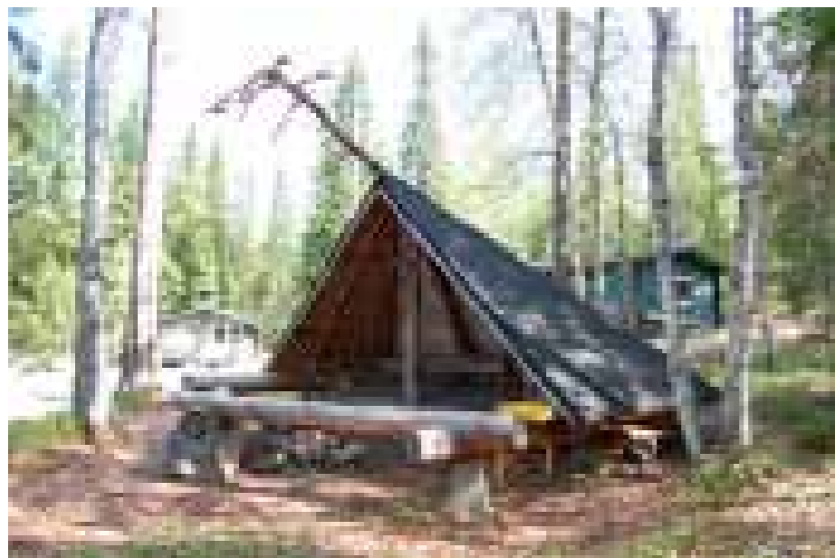
Majan pihapiirissä on laavu, varasto ja puhdasvetinen kaivo.

Majan pihalta johtaa portaat alas lammelle, jossa voi uida ja kalastaa. Majaa ympäröi hiljainen erämaa jossa voi vaeltaa, metsästää ja marjastaa.