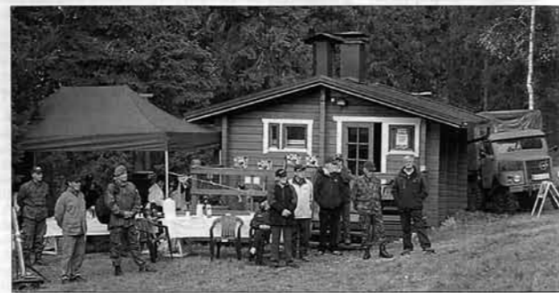
Kivalon Reserviläismaja vihittiin peruskorjauksen jälkeen käyttöön. Juhlaväkeä kokoontuneena saunan edustalle.

Kivalon Reserviläismaja ry omistaa majarakennukset ja ton-